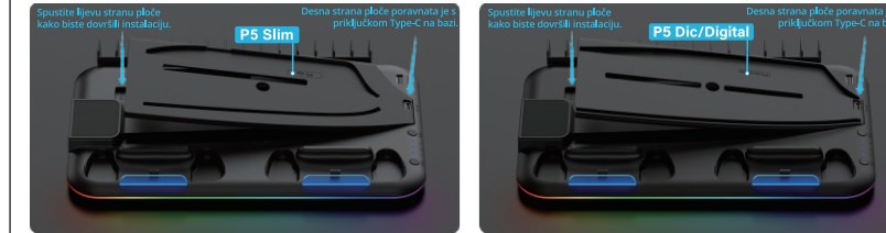
Instalacija PS slim konzole