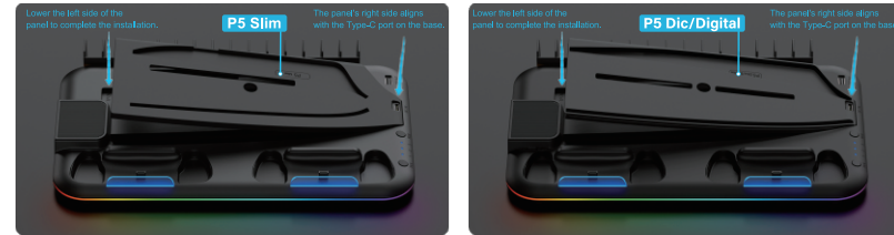
For PS Slim Panel Installation method